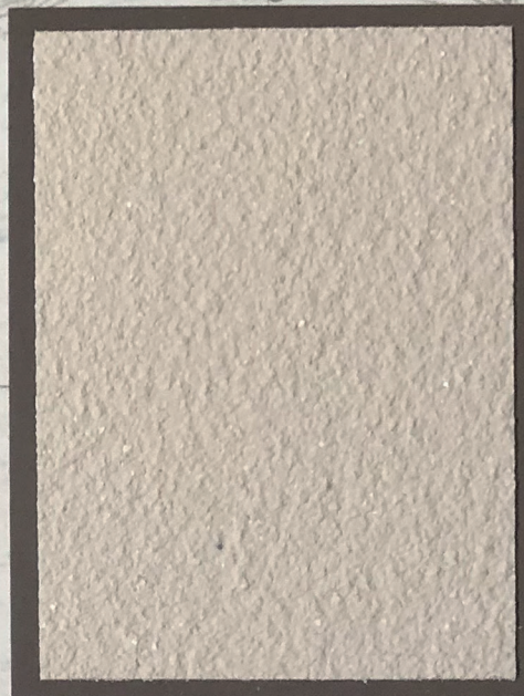
Primer Mixocal Extra Fine