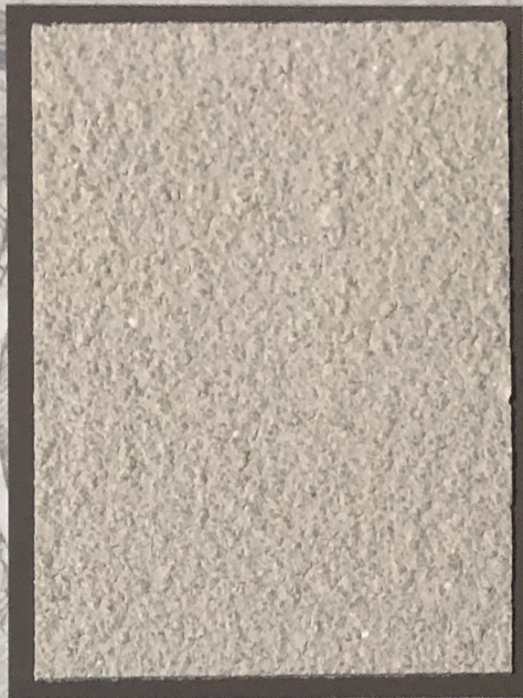
Primer Mixocal Fine